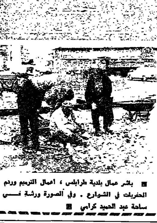
بشر عمال بلدية طرابلس ، أعمال الترميم ورم الخبزات في الشوارع . وفي الصورة ورشة تسيي ساحة عبد الحميد كرامي

طرابلس - مكتب الانوار : النشاط الرسمي ، كان بجارية طيلة الاسبوع الماضي حيث ان المحافظ ناضل حربية كان قد انتقل الى بيروت يوم الاحد الماضي وبمعه الجيش التربوي احمد همام زيادة بصحة عضو اللجنة المركزية في محافظته . وقد اضطر المحافظ لاطالة فترة وجوده في العاصمة من اجل انجاز عدة قضايا اهمها وضع خطة عمل لاعادة المهجرين الى قرانهم الشمالية وتعيين «مواقف» لارتوبيسات خط بيروت - طرابلس . وكان من المفروض ان يدمي المدمدون في طرابلس والشمال لتعيين عروضهم بشأن ترميم السراي وتكسية طبل والسجن المركزي وبمبنى المهنية وسواه ، بمسد ان يكون المحافظ حورية قد اصغر قراره بتسمية اعضاء اللجان الفرعية . غير ان تأخره في بيروت قد تجر تسمية تلك اللجان وبالتالي اخر تقديم العروض الى هذا الاسبوع حيث ستشهد عاصمة الشمال نشاطا رسميا ملموسا على صعيد الاعمال والبناء .